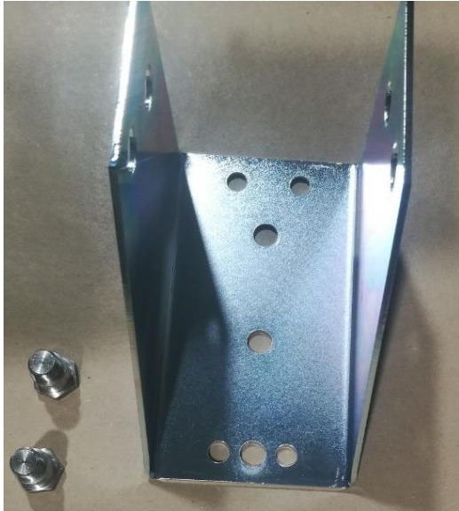
Konsole mit Verschraubung