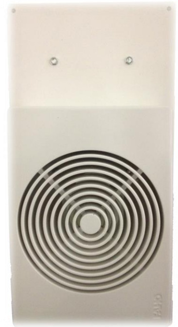
Darstellung mit FRAVO

Ein Aufmaß der vorhandenen Öffnungen ist dringend erforderlich!